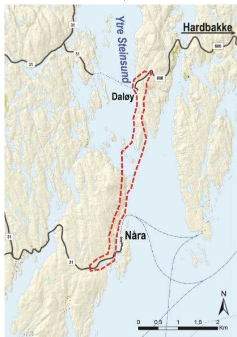
Figur 2: Ved varsel om oppstart av planarbeidet omfatta planen dette området.

Aust for planområdet er endelig vedtekt reguleringsplan for Fv. 606 Ytre Steinsund Bru, ikrafttredelsesdato 19.12.2017, Plan-ID: 201702.