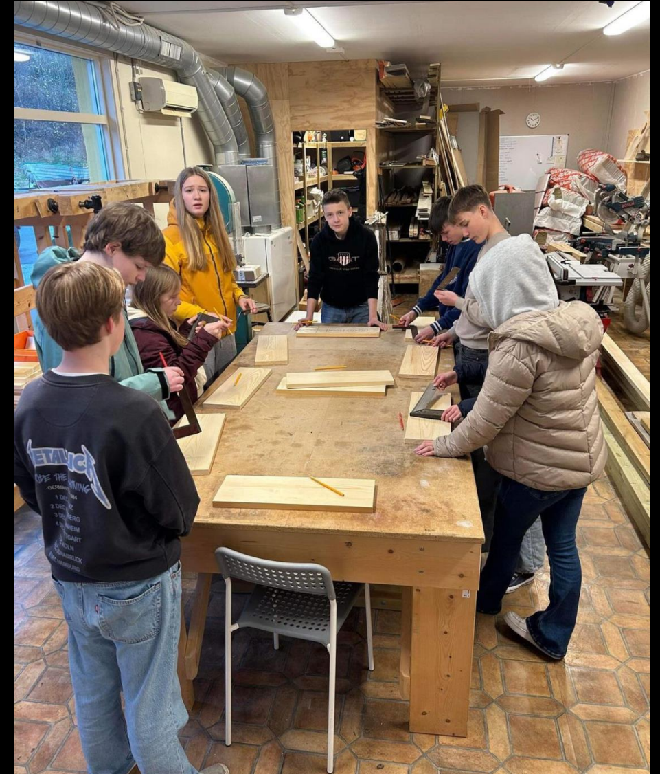
Arbeidsplass hos NKKA